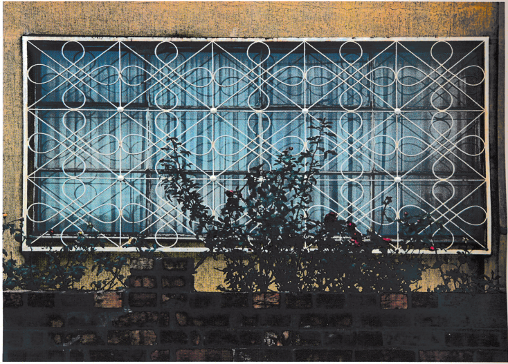
نافذة شمسية 2 من سلسلة الحدائق المنزلية 2010