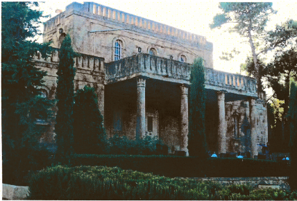
فيلاً إيفه بالمير - سيكيليانوس وزوجها.

إيفه بالمير - سيكيليانوس (1874-1952) أمريكية في كسيلوكاسترو