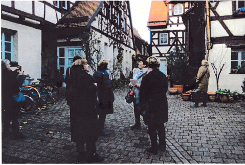
جولات داخل المدينة برفقة مرشد سياحي

الثقافة في فورت نسائية المدرسة الشعبية (وهي مدرسة للجميع) في فورت هي فضاء ترتاده النساء بالدرجة الأولى: 70% إلى 75% من المشاركين في الدورات والتظاهرات التي تقدمها هذه المدرسة هن من النساء، مؤرعات على شتى الاختصاصات والمواد الدراسية. كما أن عدد المدرسات فيها يفوق بكثير عدد المدرسين، أي بنسبة 73%. 9