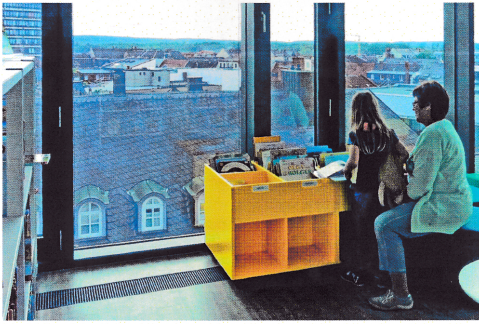
مكتبة في وسط مدينة فورت

«عندما نرغبنا أصوات الأطفال في الملاعب، نذهب إلى المكتبة»