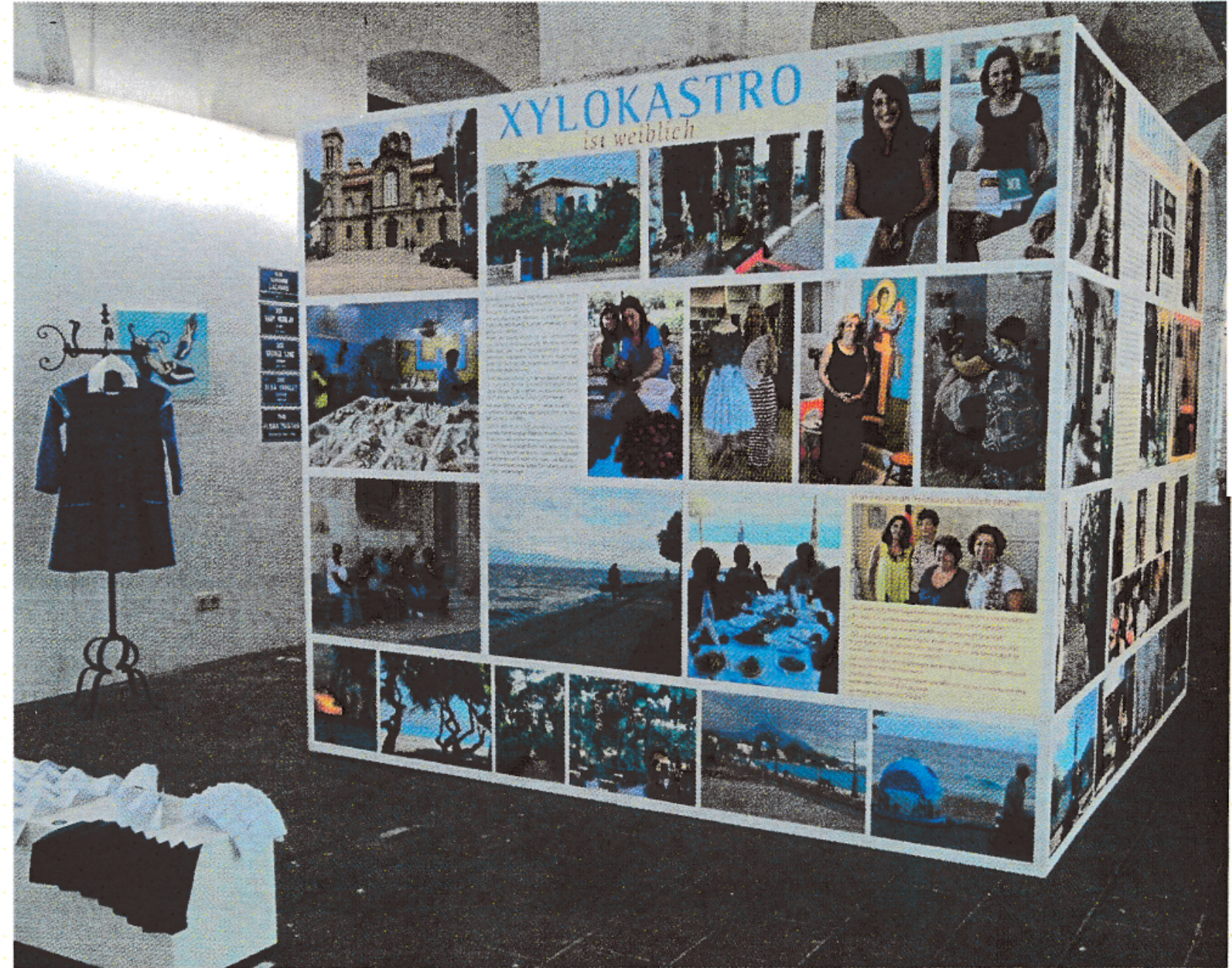
صفحة 88-89: مجموعة من الصور تحمل انطباعات عن زيارة وفود المدن الشريكة في إطار البرنامج الاحتفالي بمناسبة مرور 200 سنة على استقلالية فورت، 14 جويلية «تحية فرنسا»، زيارة وفد نسائي من كينيا، ورشة عمل مع الأطفال: مشاهد من مدينتي - مكاني المفضل